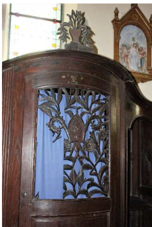
Confessionnal du XVIII ème siècle